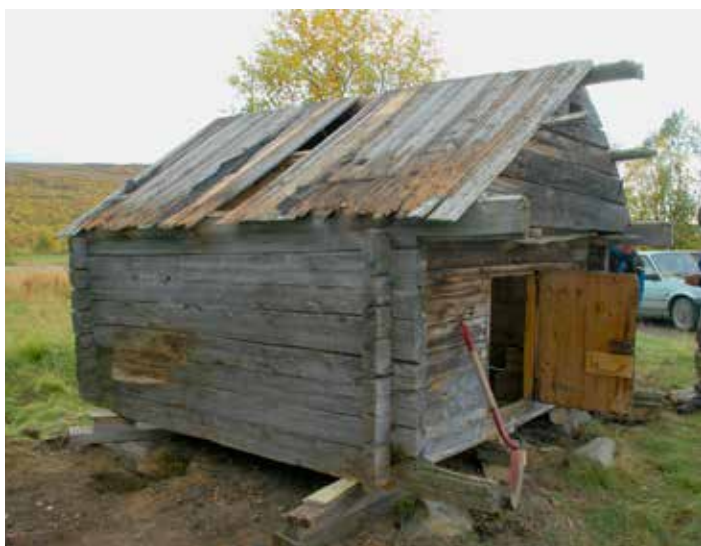
Dåvvome buvreste Deatnusne