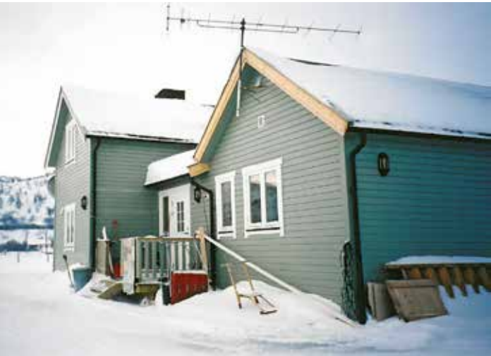
Gåetie Deatnusne. Bìhkedimmiem mietie Saemiedigkeste akte soejkesje dorjesovvi juktie gâetiem stuerididh. Rìjheantikvaare dispensasjovnem vedti jis soejkesjem jeakadi.

Gåetieh bööremeslaakan gorresuvvieh iemie átnoen tjírrh jìh gosse dejtie jaabnan vâáksje jìh gorrede. Áejvieprinsihpe gorredæmman lea dejtie gâetiebielide mah lin gâetesne aalkoelisnie, vaarjelidh dan gâhkese gâarede. Edtja bøøremes seam-malaakan gorredidh goh gosse gâetie bigkesovvi. Aajhtere maahta ahkedh gorredimmiem darjodh, goh taahtjoem