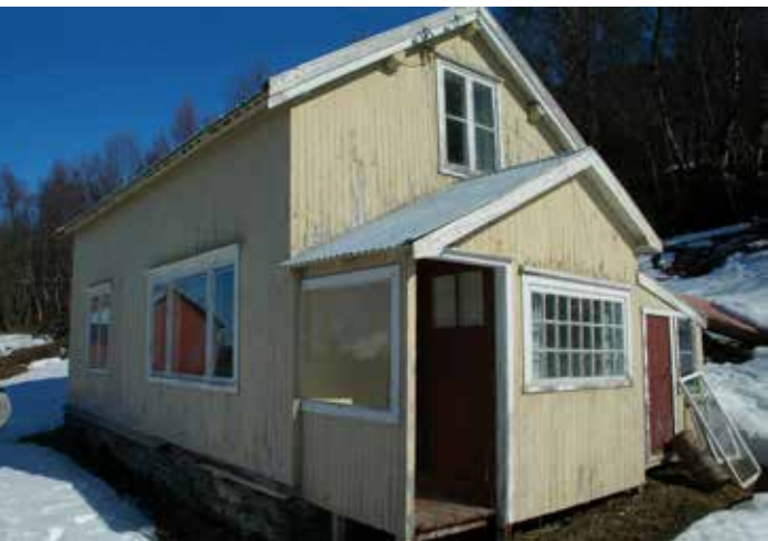
Gåetie Kåfjovlesne. Dispensasjovne vadtasovvi juktie nuerebe lissiegâetiem ryvestidh jìh orre lissiegâetiem tseegkedh. Dispensasjovne aaj jeatjah jarkelimmieh feerhmi rehpesne, rehpiestravkah, áejviebielkh, isolasjovne jìh bæjhpoe jìh aaj naan orre klaash.

dåvvodh seamma iebnine, klaash dåvvodh, seamma klaerine jìh faerpiesáarhtine máaladidh jìh vielie.