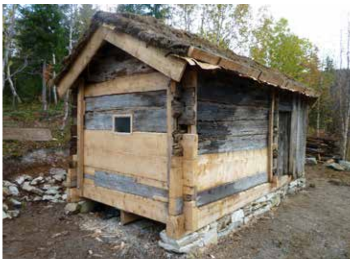
Ol' Andersen buvrie Hemnesesne. Dispensasjovne vadtasovvi buvriem sirtedh akten sjehtelesamnes sæjjan dåvvomen åvtelen. Akte krievenasse lij dah tjoeri buvriem vihtiestidh jñh dåvvodh antikvareles prinsihpi mietie.

Vaeltieh bäärhte stråmhpoeh jñh sermiem rehpeste jaabnan. Dellie rehpie guhkebem ryöhkoe, ij dan leevles sjidth, jñh lopme aelhkebelaakan rehpeste reehkie.