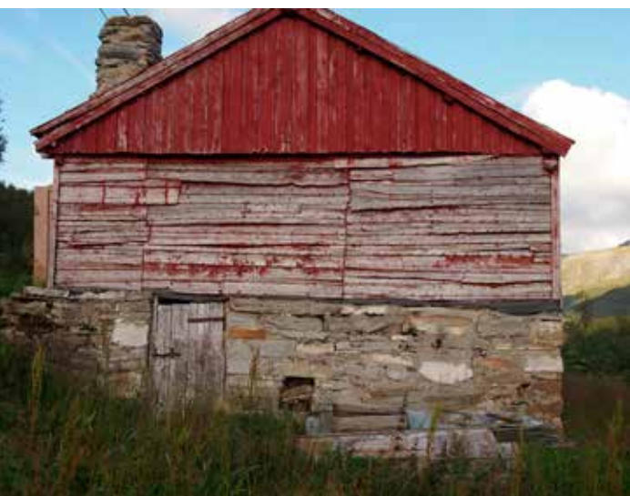
Fievsie Skániidesne /Skånland

Aajhterh dïedtem utnieh gâetiej maaksoej jih gorredimmien âvteste, jih dïhte dorjesávva næn- noestimmiej mietie soejesje- jih bigkemelaakesne jih kultuvremojhteselaakesne.