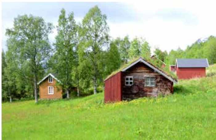
Elvebakken gaertene Balsfjovlesne

Gellie saemien gąetieh leah jeatjhtovveme jaepieh doekoe. Gąetien hammoe, konstruksjovne, materijaaleątnoe, bįjjeskieriegietedimmie, ątnoe jallh byjreseektiedimmie maahat jeatjahlaakan ąrrodh. Aaj byjreske jįh byjrese gąetien bįjre maehtieh jeatjahlaakan ąrrodh. Jalhts gąetie ij leah naemhtie guktie lij aalkoelisnie, jarkelimmieh maehtieh kultuvremojhteseaarvoem